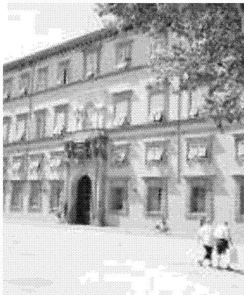
Palazzo Ducale sede della Provincia (Vip)

Palazzo Ducale mette a disposizione 2 milioni e 800mila euro. Le attività saranno completamente gratuite